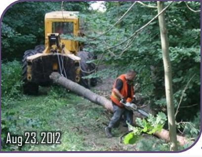
Aug 23, 2012