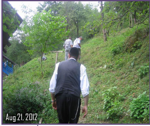
Aug 21, 2012

עסקני אבותינו ריזן קיין אייראפע צו אינטערנעוירן לטובת הצלת קברי אבות