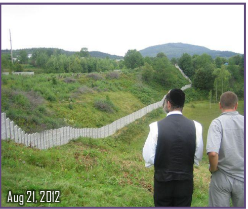
Aug 21, 2012