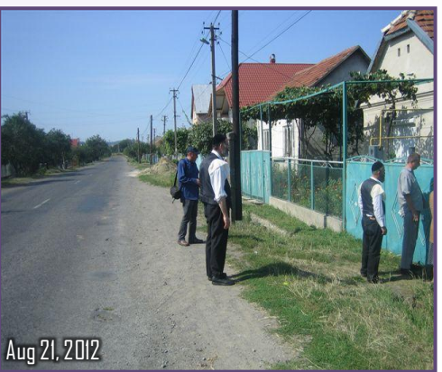
Aug 21, 2012